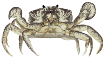
krabik amerykański Rhithropanopeus harrisi

Przypisz do każdej z map jeden z niżej wymienionych gatunków obcych występujących w Bałtyku. Na każdej mapie i w legendzie zaznacz różnymi kolorami obszar naturalnego występowania gatunku (kolor zielony) i obszar zasiedlony w wyniku introdukcji (kolor czerwony).