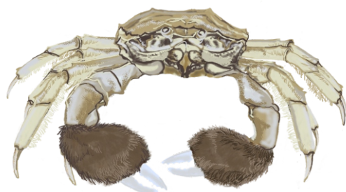
krab wełnistoręki Eriocheir sinensis

„Morze Czarne, Morze Azowskie i Morze Kaspjskie są moim domem. W wodach balastowych statków przybyłam m.in. do Polski. W Zatoce Gdańskiej po raz pierwszy znaleziono mnie w 1990 roku.”